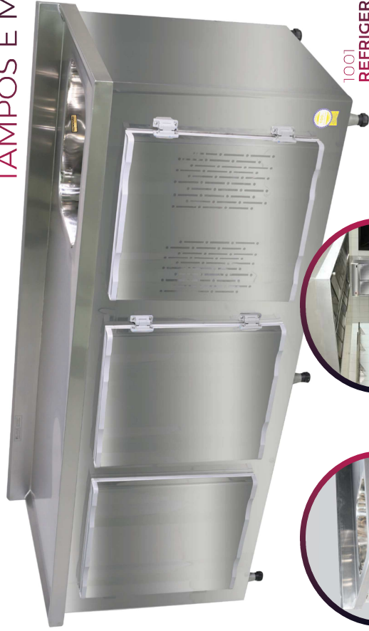
1001 REFRIGERADOR HORIZONTAL COM OPCIONAL: CUBA 40X23X14