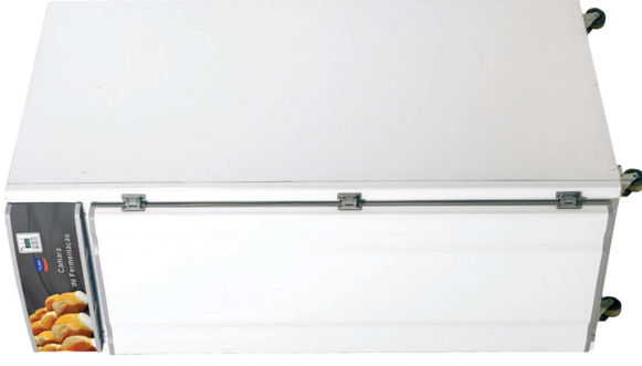
0180 - CÂM. FERMENTAÇÃO CAPAC. 20 ESTEIRAS, BRANCA