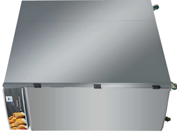
0181.6 - CAPAC. 40 ESTEIRAS, INOX