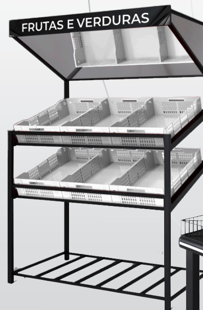
1550.5 VASCA Lateral CAPAC. 6/9 CXS TESTEIRA ESPELHO