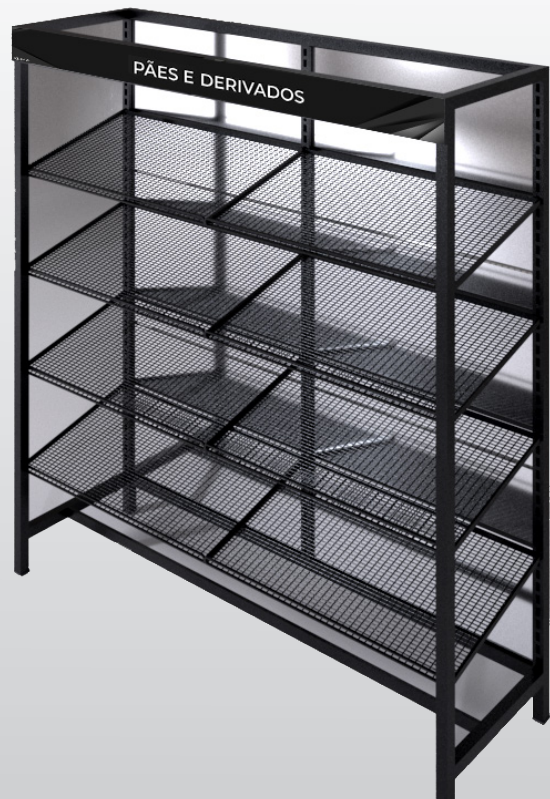
1304.M VITRINE Para pães 1,5M ABERTA