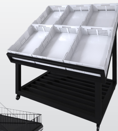
1540.1 VASCA Lateral CAPAC. 6 CXS